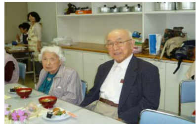
美味しい手作りうどんで昼食です。