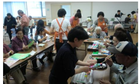
みんなで楽しく作品づくり