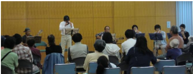
オカリナとギターの音色で癒されました ♪

例年ですと、りぼんの利用者で参加を希望された方々と、昼食をご一緒したり、余興やゲームを楽しんで交流を図るという会でした。おかげさまで好評をいただき、年中行事として定着していましたが、今年度は、もう少し地域に開かれた形で地域の方々と交流をしたいと考え、長房ふれあい館において開催することを決め、地域の方々にも参加を呼びかけました。当日はりぼん職員による手打ちうどんを食べたり、はちふくネットさんのオカリナ演奏、デイサービス体験、高齢者体験など盛りだくさんのプログラムを楽しみながら、幼児から高齢の方まで世代を超えた交流が図れ、有意義な一日となりました。