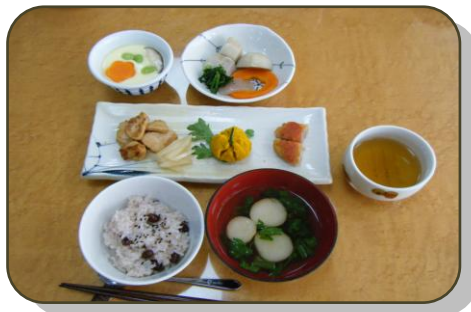
美しい声を出した後はお楽しみのお食事です。 こちらはお誕生日御膳でお赤飯です。