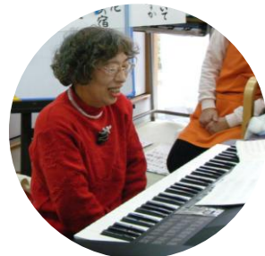
ピアノの生伴奏で歌います♪