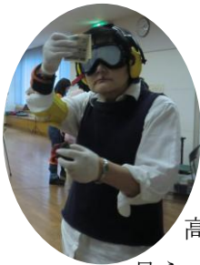
高齢者体験 見えづらいわ…